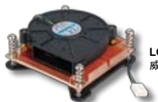
LGA1156 风扇 威强 P/N: CF-1156A-RS